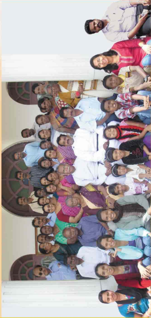
നാർഷിക വിദ്യാർത്ഥികളുടെ നന്മയ്ക്കായി നടത്തിയ സമ്മേളനങ്ങൾ