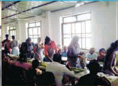
Church Day Love Feast