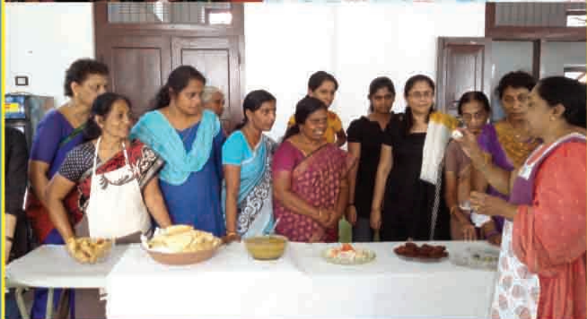
Albert Joseph Memorial Summer School of Church Music 2015