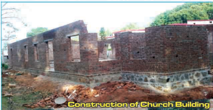
Construction of Church Building in Khandamal, Orissa