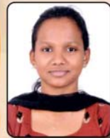
Jeena Justus Plus Two

വിദ്യാഭ്യാസ രേഖകളിൽ നമ്മുടെ കുഞ്ഞുങ്ങളെ ട്രൈം നേടിയതിന് അനുഗ്രഹിച്ചിരിക്കുന്നു. Class Ten/ Plus Two തലങ്ങളിൽ നമ്മുടെ കുട്ടികൾ ഉന്നത മാർക്കും ഗ്രേഡും കരസ്ഥമാക്കിയിരിക്കുന്നു. ദൈവാനുഗ്രഹത്തോടുകൂടെയുള്ള ഉപരിപഠനം ഭാരതമായിത്തീരട്ടെ എന്ന് നമുക്ക് നമുക്ക് പ്രാർത്ഥിക്കാം; ആശംസിക്കാം! യോഗ്യരായ മറ്റ് വിദ്യാർത്ഥികളുടെയും പരിശുദ്ധതയ്ക്കുള്ള പരിശോധനം വിവേകവും ആകുന്നു. (സമുദായം 9-10)