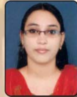
Anjana U.S. Plus Two