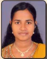
Delin C. CBSE X