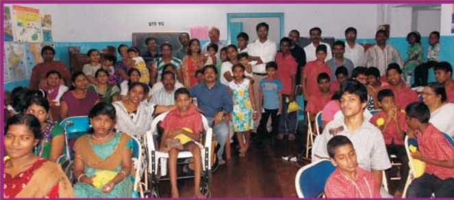
YFF visit to Cerebral Palsy Home